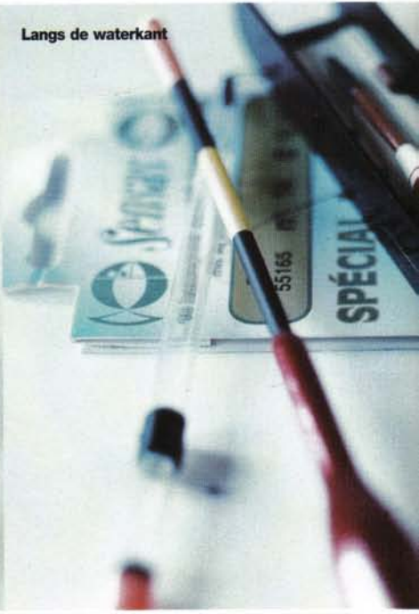
Langs de waterkant