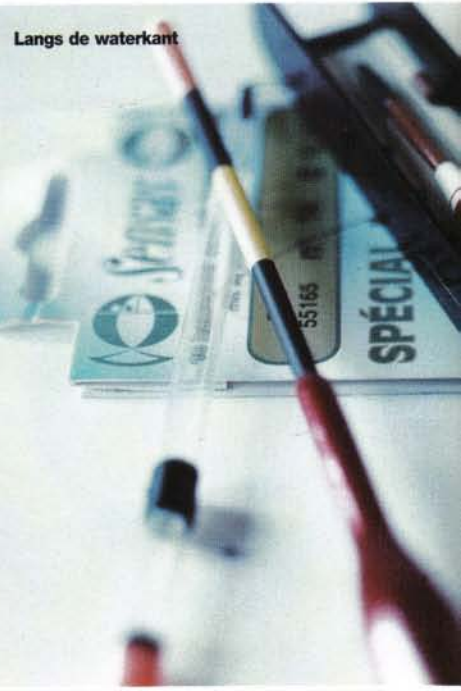
Langs de waterkant